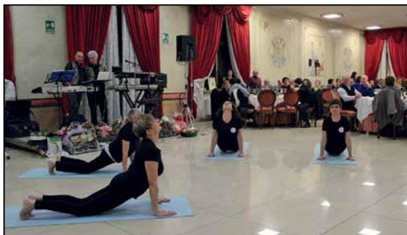
Un esercizio di yoga durante la serata dell'Eco.

Infatti, come le tensioni fisiche possono provocare, oltre che aggravare, la tensione mentale, allo stesso modo il rilassamento fisico può portare serenità a una mente preoccupata .