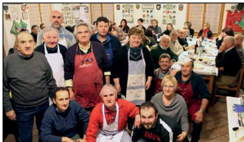
Il gruppo di lavoro degli Alpini per la cena benefica.

Un gruppo di Alpini, coadiuvati anche da alcune mogli, sono stati come sempre gratificati del loro impegno dai complimenti dei commensali per i piatti