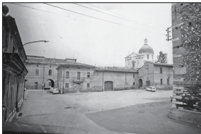
La piazzetta del Teatro, dove negli anni Novanta si parcheggiavano numerose automobili. Ora è tempo di rivedere il progetto per soddisfare viabilità, parcheggi e senso estetico della zona per un più razionale utilizzo di una piazzetta che si presta a diversi utilizzi.

Certo non sarà facile coniugare la richiesta di minori oneri, in senso assoluto, con i numerosi servizi e la qualità degli stessi richiesti dai cittadini; è qui che il dialogo, la collaborazione dei tecnici con il nuovo Dirigente (prepara-