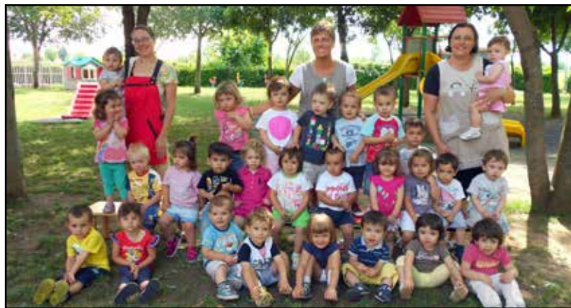
Una sezione del Nido di bambini felici, con alcune maestre.

I grandi hanno potuto visitare la struttura, giocare con i propri bambini utilizzando i diversi materiali e i giochi proposti dalle educatrici: travasi con farina gialla, manipolazione con il didò, angolo morbido per coc-