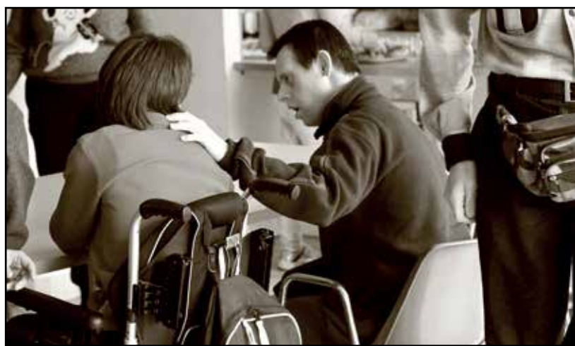
Gli ospiti del Centro Diurni per disabili.

E' grave il senso di sicurezza minato ed il timore che vive ora chi frequenta il servizio.