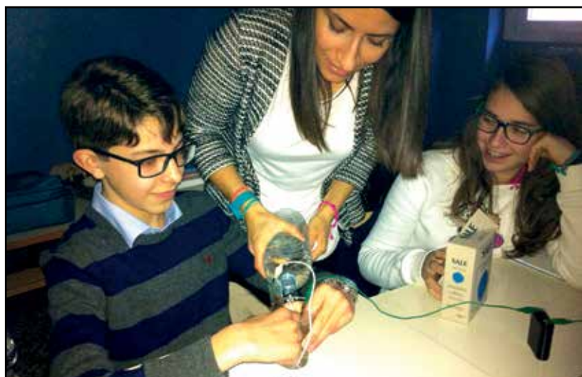
La fase di un esperimento.

Gli incontri si sono chiusi venerdì 30 gennaio, con la partecipazione dei ragazzi di terza media. Anche in questo caso, l'uscita didattica, intitolata "Mondo telefono", verteva su un tema molto amato dai giovani: il cellulare. Gli studenti hanno così avuto modo di conoscere molti particolari poco noti di questo oggetto che maneggiano in continuazione, come ad esempio l'origine del nome "cellulare", i materiali che lo costituiscono, la provenienza geografica degli stessi, le modalità di smaltimento degli apparecchi non più funzionanti. Anche in questo caso, l'incontro si è chiuso con una veloce sortita all'inter-