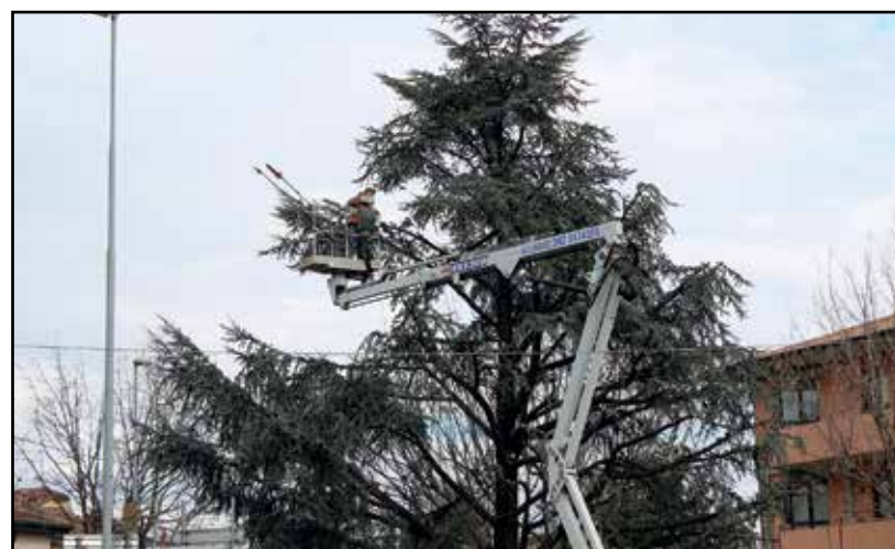
Gli alberi vittime dell'ultima nevicata.